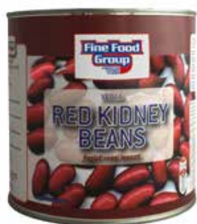
VE01A/RED KIDNEY BEANS FFG

Fagioli neri messicani interi, lessati 6 x 2,5 kg