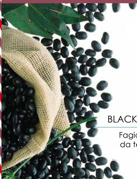
VE81A/ BLACK BEANS DRY

Fagioli secchi neri, da tenere a mollo e poi bollire 1 x 5 kg