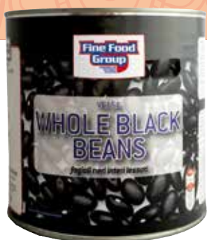
VE15A/WHOLE BLACK BEANS FFG

Fagioli neri messicani interi, lessati 6 x 2,5 kg